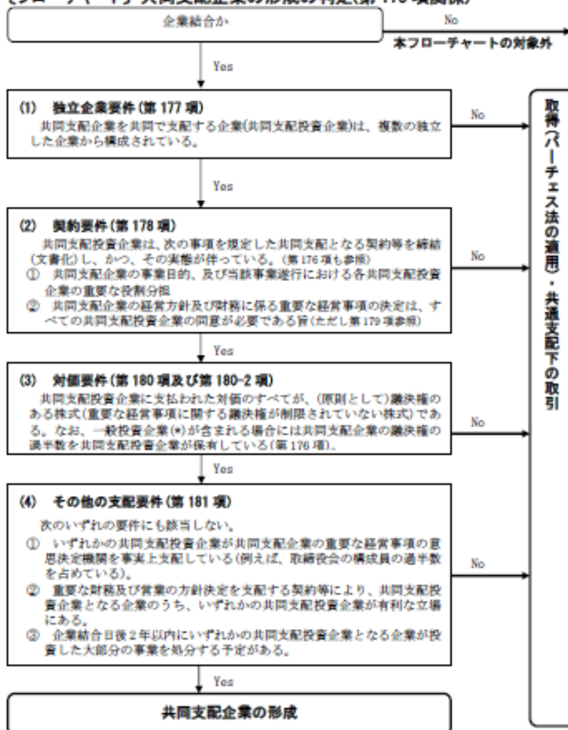
【フローチャート】 共同支配企業の形成の判定(第 175 項関係)

(*) 結合後企業が共同支配企業と判定されることを前提に、当該共同支配企業へ投資する企業の中に契約要件を満たさない企業が含まれている場合、当該企業を一般投資企業という。